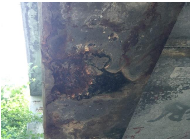
Abbildung 9 Betonabplatzungen bis zur Bewehrung am Überbau