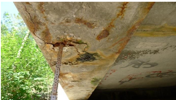
Abbildung 8 Betonabplatzungen bis zur Bewehrung am Überbau