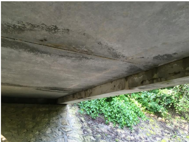
Abbildung 3 Untersicht zeigt Durchfeuchtung, Abplatzungen und Risse