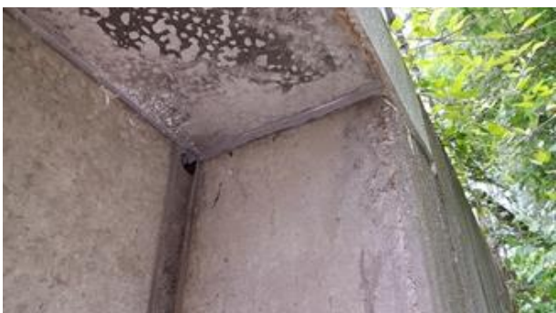
Abbildung 10 Fugen gerissen und defekt