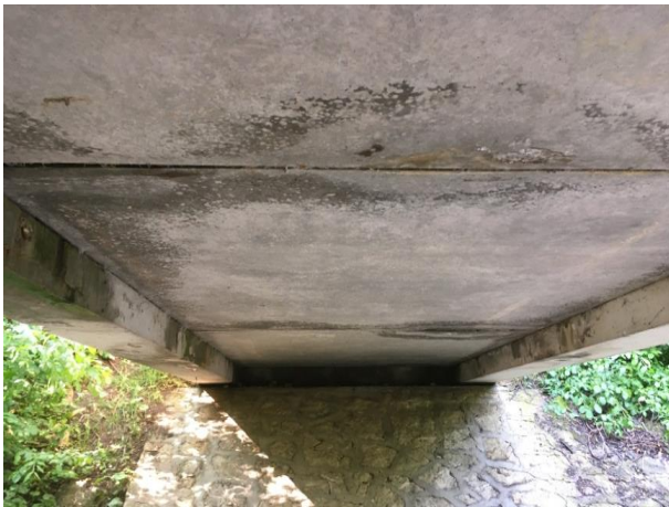
Abbildung 5 Untersicht zeigt Durchfeuchtung, Abplatzungen und Risse