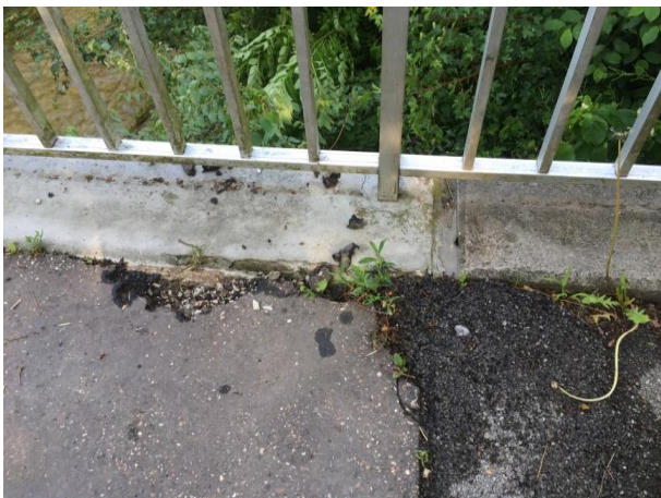
Abbildung 13 Fugen defekt und Asphalt ausgebrochen