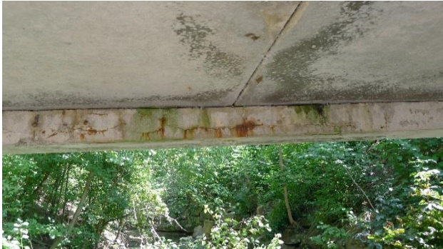
Abbildung 7 Risse mit Rostfahne und Aussinterung