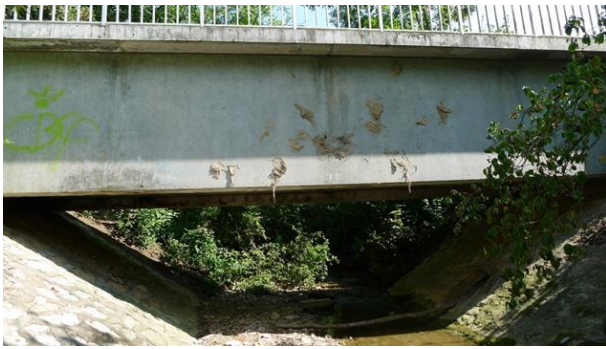
Abbildung 1 Brückenansicht