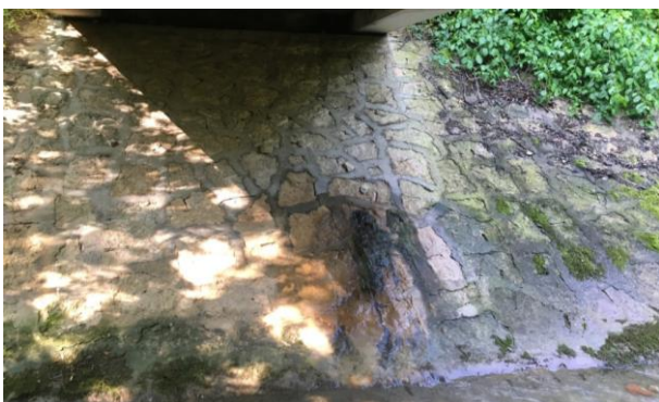
Abbildung 14 Wasser drückt durch die befestigte Wiederlagerfläche