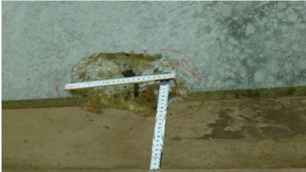
Abbildung 11 Betonabplatzungen