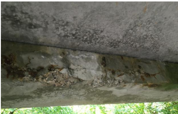
Abbildung 6 Abplatzung des Betons bis zur Bewehrung am Überbau