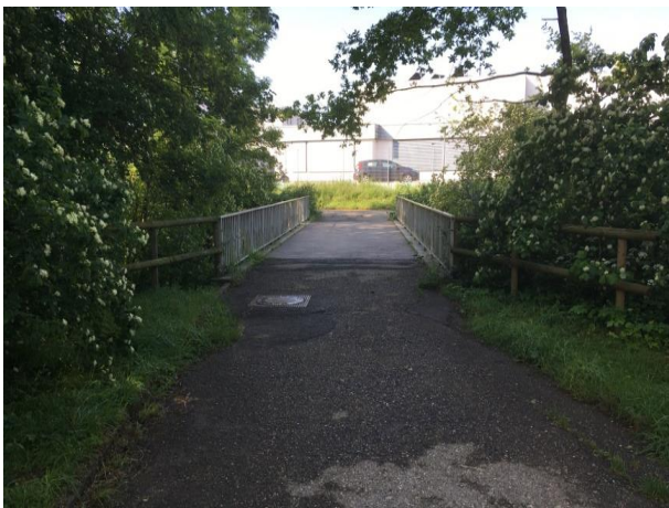
Abbildung 2 nördlicher Zugang