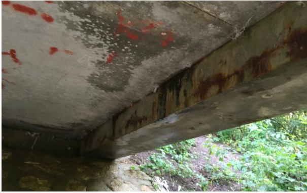
Abbildung 4 Risse mit Rostfahne und Aussinterung