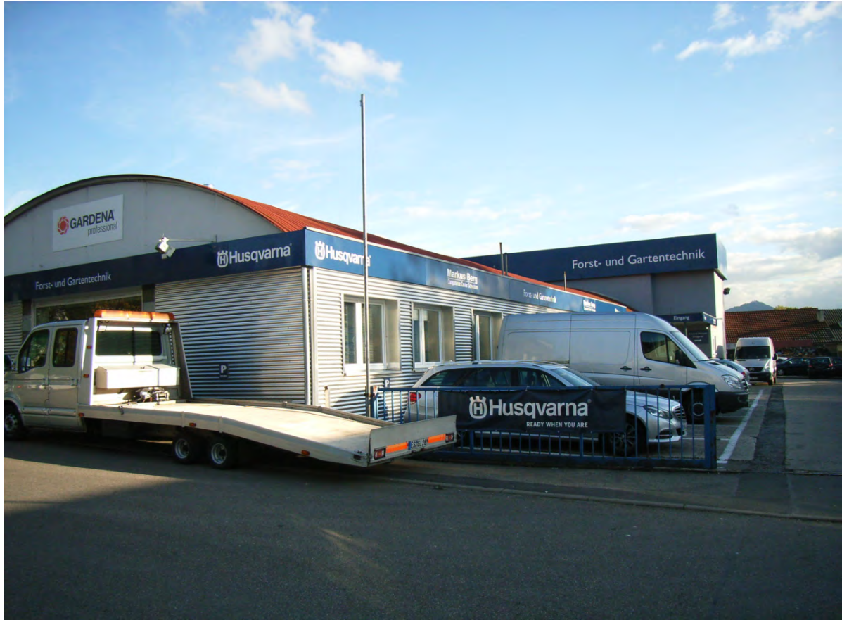
Abb. 3: Blick auf das Gewerbegebäude Zementstraße 18.