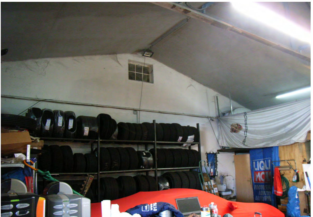
Abb. 12: Werkstatt im Betriebsgebäude Zementstraße 14.