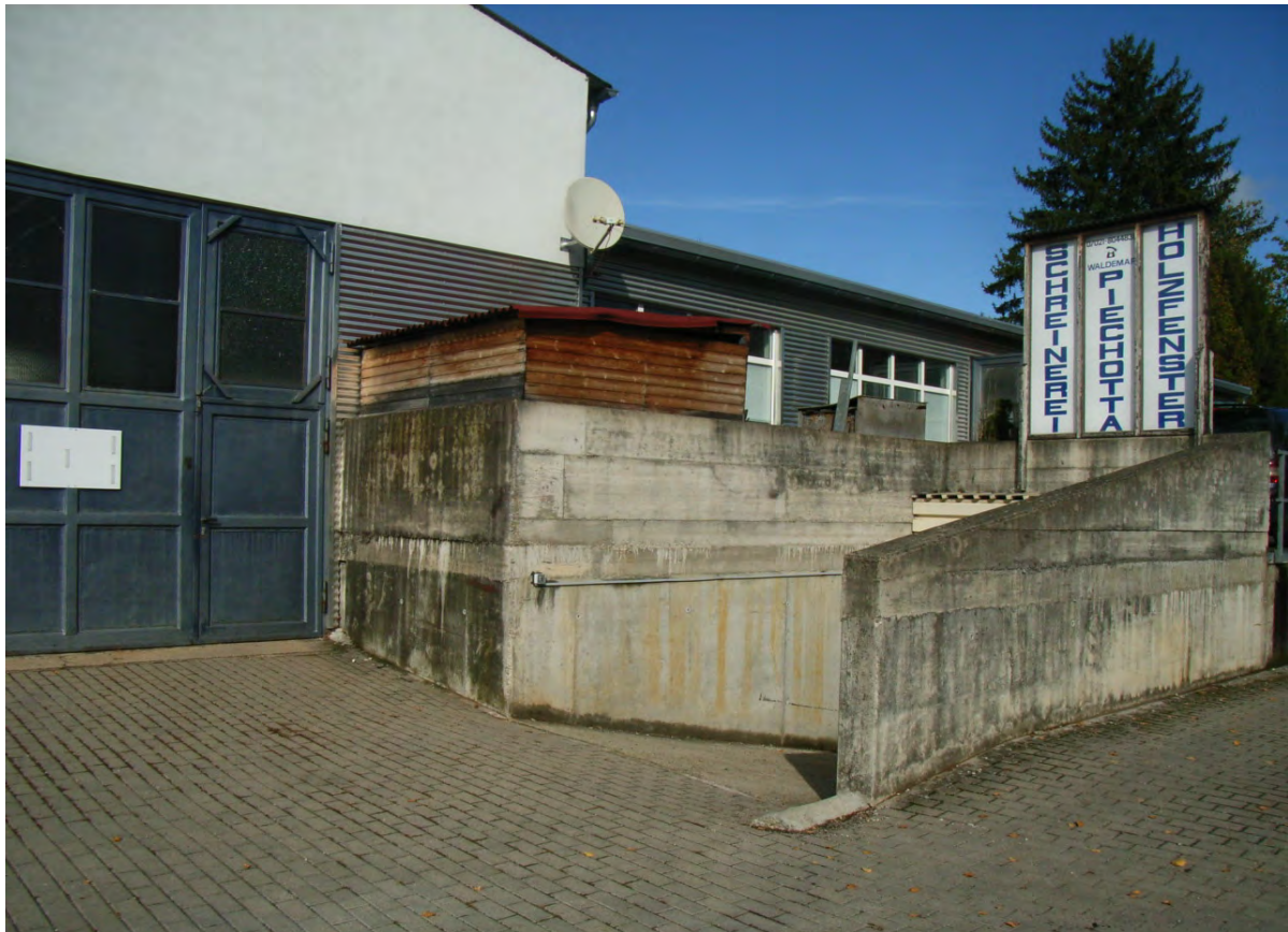
Abb. 6: Gewerbegebäude Zementstraße 16 mit Tiefgaragenzufahrt.