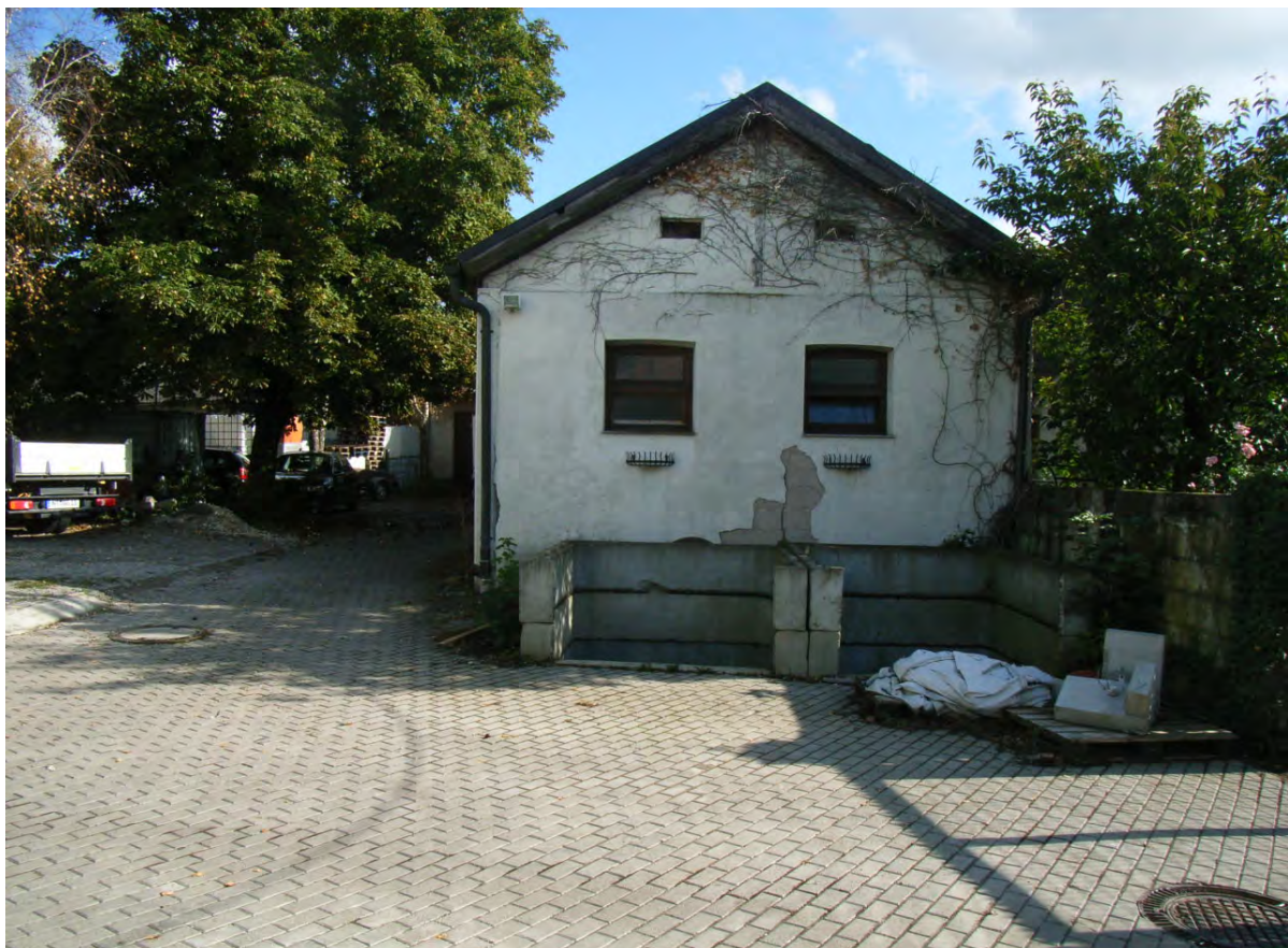
Abb. 8: Stallgebäude auf Flurstück-Nr. 3120.