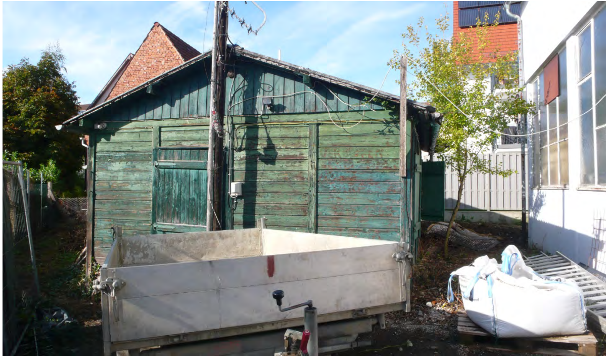
Abb. 7: Holzschuppen beim Gewerbegebäude Zementstraße 16.