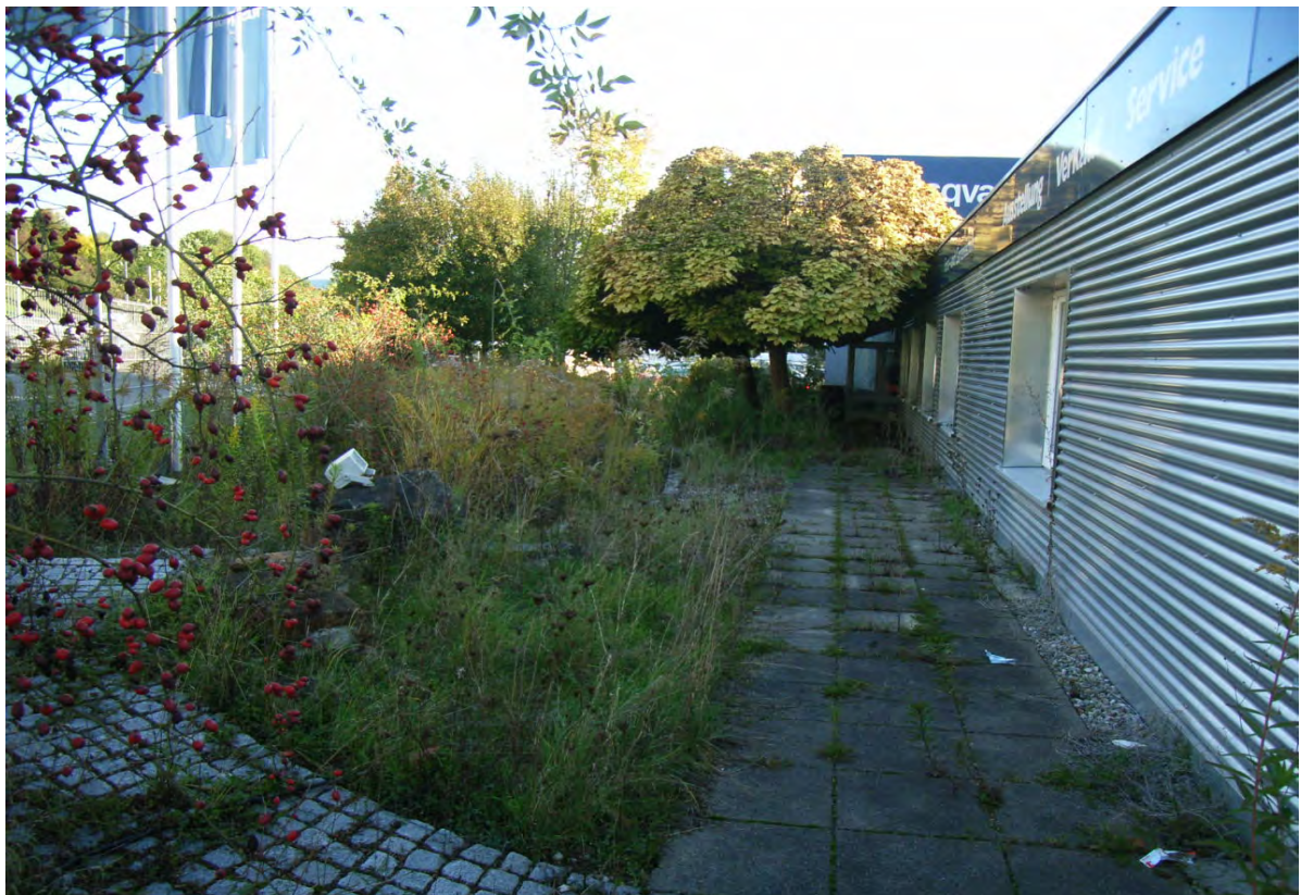
Abb. 4: Blick auf die Grünfläche beim Gewerbegebäude Zementstraße 18.