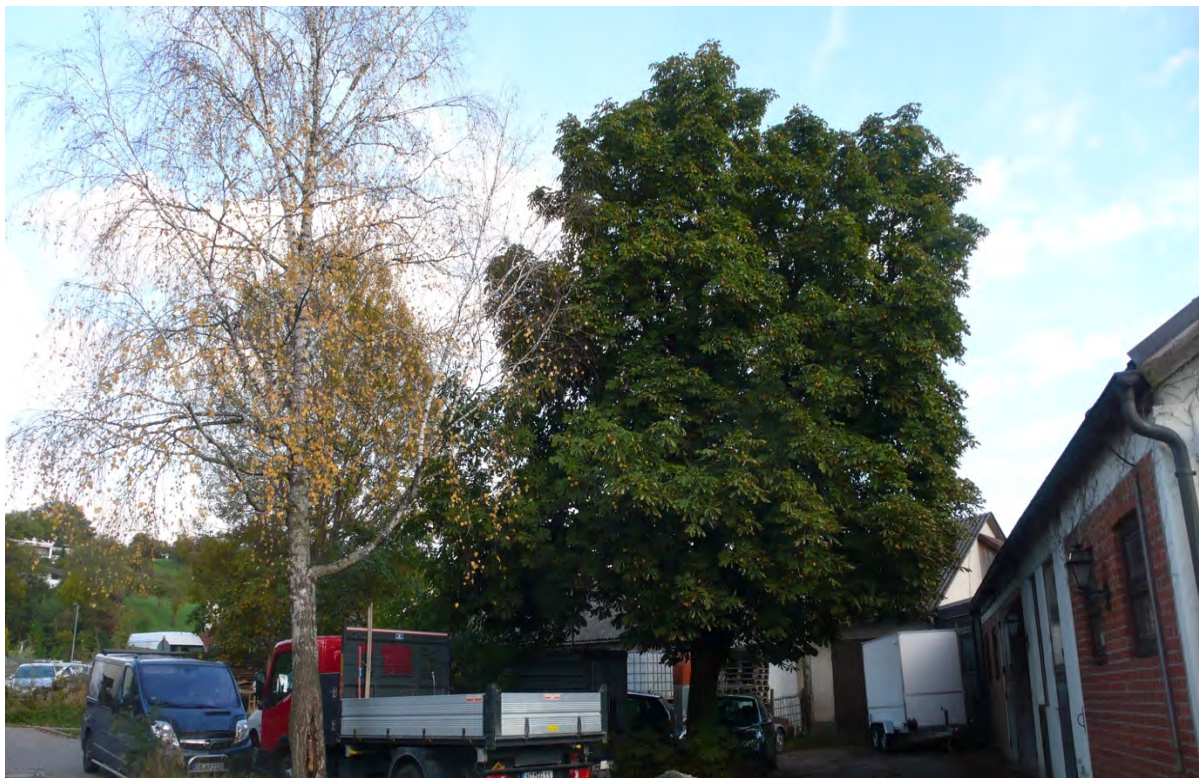
Abb. 10: Gehölzgruppe auf Flurstück-Nr. 3120.