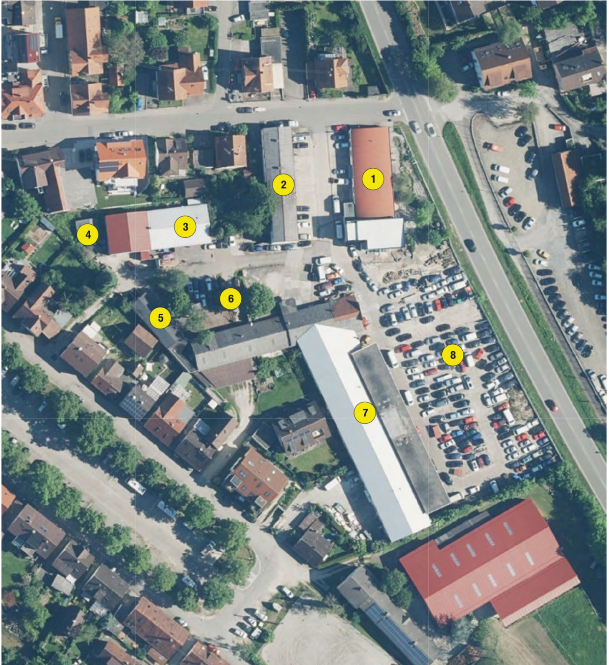
Abb. 15: Untersuchungsgebiet, die Nummern im Luftbild entsprechen den Nummern in Tabelle 1 (unmaßstäblich).