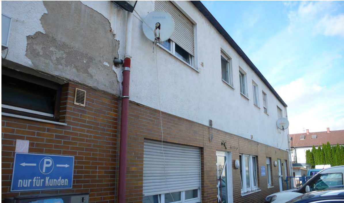
Abb. 5: Wohn- und Gewerbegebäude Zementstraße 14.