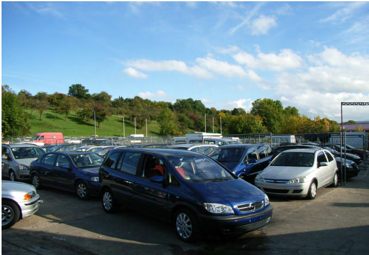
Abb. 14: Parkplatzfläche auf Flurstück-Nr. 3123.