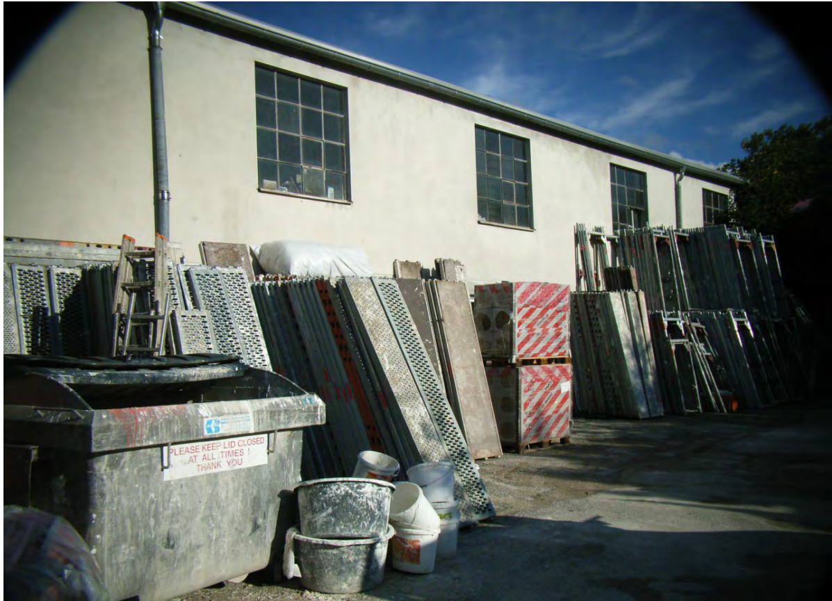
Abb. 13: Südlicher Teil des Betriebsgebäude Zementstraße 14.