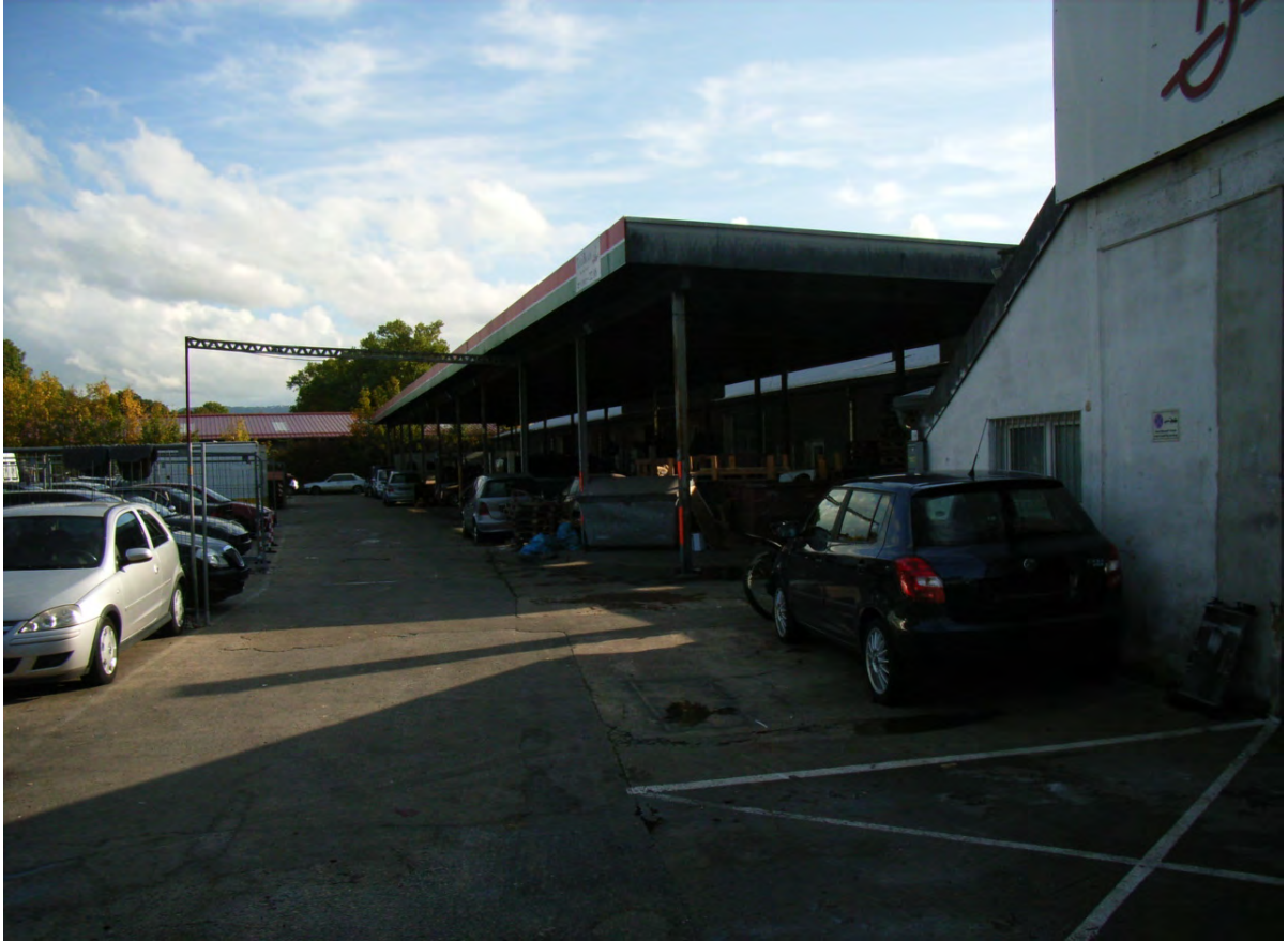
Abb. 11: Betriebsgebäude Zementstraße 14 und angrenzende Parkplatzfläche.