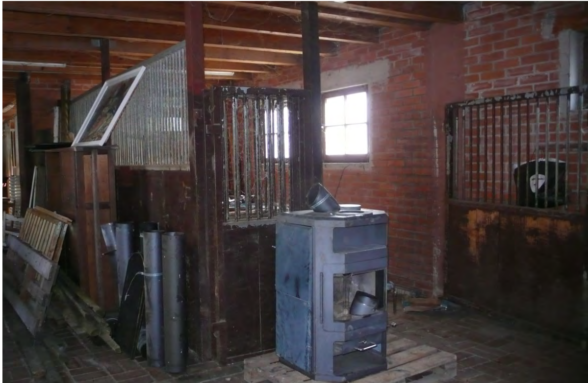
Abb. 9: Innenbereiche des Stallgebäudes auf Flurstück-Nr. 3120.