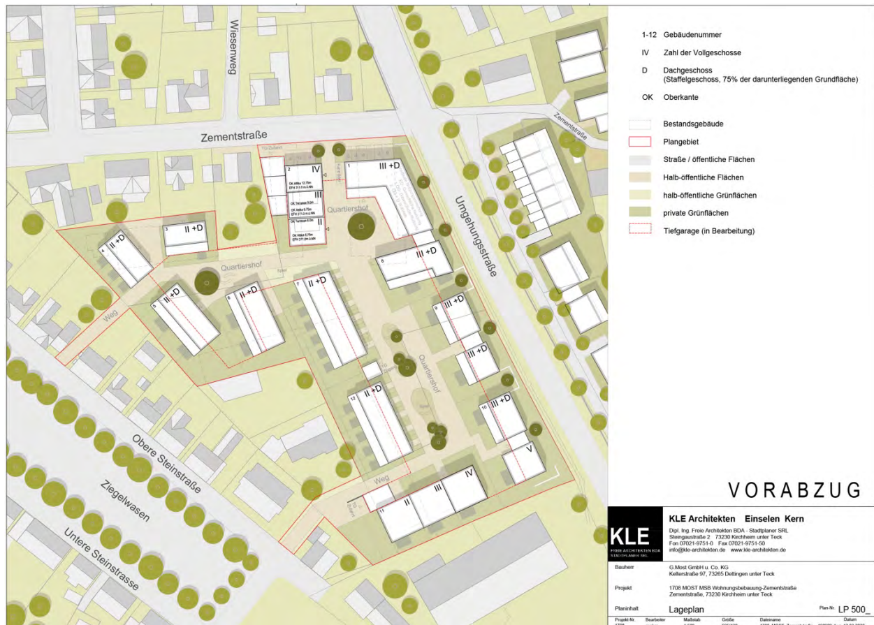
Abb. 2: Städtebauliches Entwicklungskonzept „Zementstraße – Altes Baumarktareal“ in Kirchheim unter Teck (Quelle: KLE Architekten, Stand vom 12. März 2020).

Der Vorhabenbereich „Zementstraße – Altes Baumarktareal“ in Kirchheim unter Teck soll auf den Flurstücken Nr. 2264/12, 2264/16, 3119/3, 3120 und 3123 nach Abbruch der derzeit noch bestehenden Wohn- und Gewerbegebäude bzw. Lagerhallen größtenteils mit Tiefgaragen überbaut werden. Darauf sollen Gebäude mit Freiflächen entstehen (s. Abb. 2).