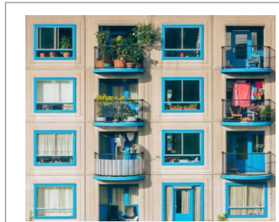
Handlungsfeld „Wohnen und Quartiere“

Das Handlungsfeld „Wohnen“ umfasst die Aufgabe für unterschiedliche wirtschaftliche Möglichkeiten, Lebenslagen und Lebensstile angemessenen Wohnraum ausreichend zur Verfügung zu stellen. Dies umfasst unter anderem das Schaffen der planungsrechtlichen Voraussetzungen sowie die Bereitstellung von Bauland, Wohnraum , als Bestandteil eines integrierten Städtebaus und von nutzbarem städtischem Umfeld.