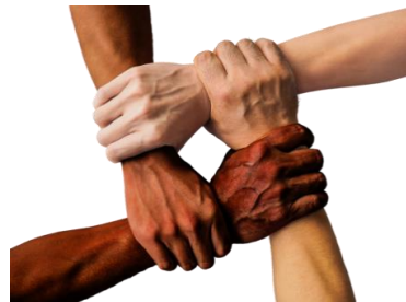
Handlungsfeld „Gesellschaftliche Teilhabe und bürgerschaftliches Engagement“

Unter diesem Handlungsfeld wird die Teilhabe aller Menschen und Gruppen an einem sozialen Gemeinwesen – angefangen von guten Lebens- und Wohnverhältnissen, Sozial- und Gesundheitsschutz, ausreichenden und allgemein zugänglichen Bildungschancen und der Integration in den Arbeitsmarkt bis hin zu vielfältigen Freizeitmöglichkeiten – verstanden. Dafür bedarf es ein kontinuierliches Bemühen der Gesellschaft (Kommune), allen Einwohnerinnen und Einwohnern Teilhabe zu eröffnen.