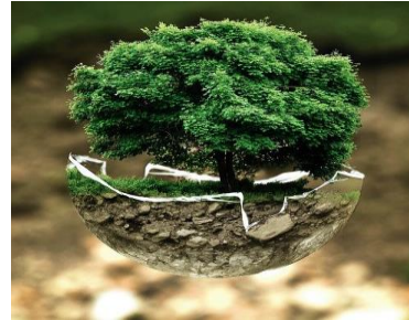
Handlungsfeld „Umwelt- und Naturschutz“

Umweltschutz als Erhaltung der natürlichen Lebensgrundlagen (insbesondere Boden, Luft, Wasser, Klima , Lebewesen) in einem funktionierenden Naturhaushalt. Der Bereich Naturschutz umfasst den Erhalt unserer identitätsstiftenden Kulturlandschaft und reichen Artenvielfalt sowie eine vorausschauende und umsichtige Stadtplanung.