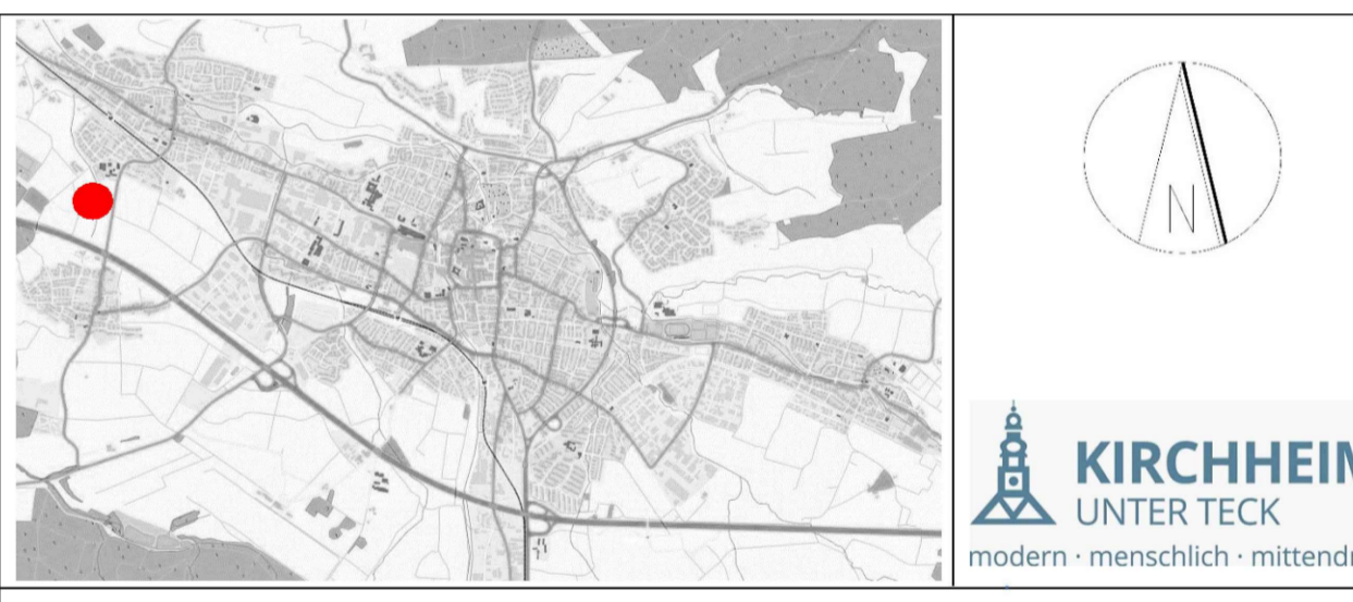
LANDKREIS ESSLINGEN - STADT KIRCHHEIM UNTER TECK - GEMARKUNG ÖTLINGEN