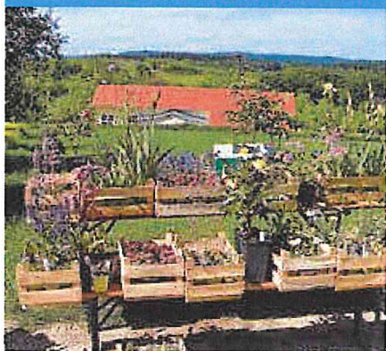
Garten.Genuss.Markt. Am 5. Mai